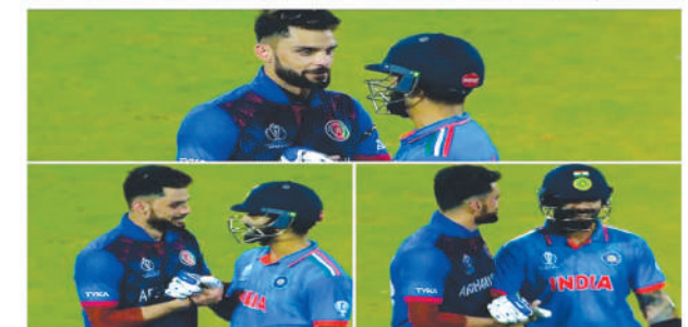
गया। इसी बीच विराट जब उन्हें समझाया देने पहुंचे तो सामने से नवीन ने सख्त लहजे में बात की। इसी बीच लखनऊ के मेंटोर बीच तलखी के बाद से क्रिकेट जगत में विराट कोहली और नवीन उल हक के बीच टक्कर देखने की उत्सुकता थी।

नई दिल्ली। इंडियन प्रीमियर लीग के दौरान मामूली कहसुनी में आगने सामने हो गए विराट कोहली और नवीन उल हक क्रिकेट विश्व कप 2023 में भारत बनाम अफगानिस्तान के मुकाबले में बदले तेवरों के साथ नजर आए। नवीन का पहले से ही दर्शक प्रत्येक मैच में कोहली कोहली के नारे से स्वागत कर रहे थे। ऐसे में कोहली ने आईपीएल के दौरान हुई मामूली झड़पों को दरकिनार करते हुए नवीन को गले लगा लिया। बता दें कि आईपीएल 2023 में जब रॉयल चैलेंजर्स बेंगलुरु और लखनऊ सुपर जायंट्स के बीच मुकाबला खेला गया था तो लखनऊ की ओर से खेले रहे नवीन अपनी टीम की जीत के बाद बेबाक जर्न मनाते दिखे थे। उनके बेबाक जर्न मनाने का तरीका पसंद नहीं किया गौतम गंभीर भी आ गए। उन्होंने विराट कोहली को गुस्से में कुछ बातें कहीं और मैच के बाद सख्त बयान भी दिए। बहरहाल, दोनों के