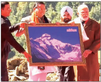
उत्तराखंड के सीएम पुष्कर सिंह धामी प्रधानमंत्री नरेंद्र मोदी को स्मृति चिन्ह भेंट करते हुए।