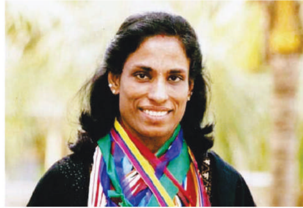
मुझे यकीन है कि भारत पेरिस ओलंपिक में तोक्यो से अधिक पदक जीतेगा। पदक जीतने के बाद हम ओलंपिक की मेजबानी का दावा कर सकते हैं। सरकार 15 से 17 अक्टूबर तक मुंबई में होने वाले अंतरराष्ट्रीय ओलंपिक समिति के सत्र के दौरान 2036 ओलंपिक की मेजबानी में रुचि जता सकती है। आईओसी के हालिया सुधारों के बाद अब ओलंपिक की मेजबानी के इच्छुक देश अपना प्रस्ताव रखेंगे और आईओसी भावी मेजबान आयोग कार्यकारी बोर्ड के सामने अपनी अनुरोध रखेगा। कार्यकारी बोर्ड उसके बाद तय करेगा कि आईओसी सत्र में प्रस्ताव मतदान के लिये रखा जायेगा या नहीं।

पीटी उषा ने कहा कि एशियाई खेलों में रिकॉर्डतोड़ प्रदर्शन के बाद अगर हमारे देश के खिलाड़ी, कोच और राष्ट्रीय महासंघ कड़ी मेहनत करें तो हम पेरिस ओलंपिक में दोहरे अंक में पदक जीत सकते हैं।' उन्होंने कहा, 'सरकार भारतीय खेलों और खिलाड़ियों की बेहतरी के लिए हरसंभव प्रयास कर रही है। हमारे प्रधानमंत्री देश के खेलों में काफी रुचि लेते हैं।' उषा ने कहा कि अब भारत को ओलंपिक की मेजबानी का दावा करना चाहिए। उन्होंने कहा,