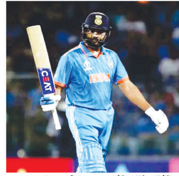
5 कुमार संगकारा, श्रीलंका 5 रिकी पॉटिंग, ऑस्ट्रेलिया 4 डेविड वॉर्नर, ऑस्ट्रेलिया अंतरराष्ट्रीय क्रिकेट में

धर्मशाला। भारतीय कप्तान रोहित शर्मा ने अफगानिस्तान के खिलाफ दिल्ली के अरुण जेटली स्टेडियम में खेले गए मुकाबले के दौरान शतक लगाकर विश्व कप इतिहास में सबसे ज्यादा शतक लगाने का रिकॉर्ड अपने नाम कर लिया। रोहित ने क्रिकेट विश्व कप 2019 में 5 शतक लगाए थे। वह ओवरऑल 6 शतक के साथ सचिन तेंदुलकर की बराबरी पर थे। लेकिन अफगानिस्तान के खिलाफ शतक लगाते ही वह इस लिस्ट में टॉप पर आ गए हैं। बड़ी बात यह है यह रोहित शर्मा की विश्व कप की 19वीं पारी है। सचिन ने 45 पारियों में 6 शतक लगाए थे। विश्व कप में सबसे ज्यादा शतक 7 रोहित शर्मा, भारत 6 सचिन तेंदुलकर, भारत